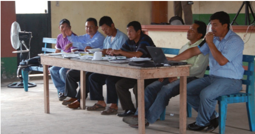
Image 3. Community meeting on local authority elections (the Centre of Limoncocha, 17 December 2011)

The new policy of government is diminishing the traditional sense of ownership and communitarian spirit. There is a legalization of the land ownership, and people receive property deeds. This is in contrast to the communitarian culture, where a common feeling dominates that the land belongs to everybody (image 3). Formalizing the ownership and giving the land to an individual is a foreign custom dictated on the people of Limoncocha: