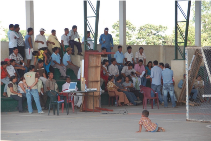
Image 2. Community meeting discussing the issue of Limoncocha's future (considering the development plan of Shushufindi, the issue of project preparations, and the ministerial ban forbidding fishing in the Lagoon) with representatives from the Municipality of Shushufindi Parish (the Centre of Limoncocha, 9 December 2011)

Another indicator of communitarian attitude could be the opinion expressed by community members about the scholarships for the best students. In Limoncocha only a few students have received grants or scholarships financed by the government. However, many other students would like to study but they have no chance to receive money for it. In the opinion of Limoncocha inhabitants the money should be distributed for all the candidates who want to study. Moreover, if somebody graduates from the University he or she should thank community for the chance for receiving the diploma. If graduates do not do this they are accused of ingratitude.