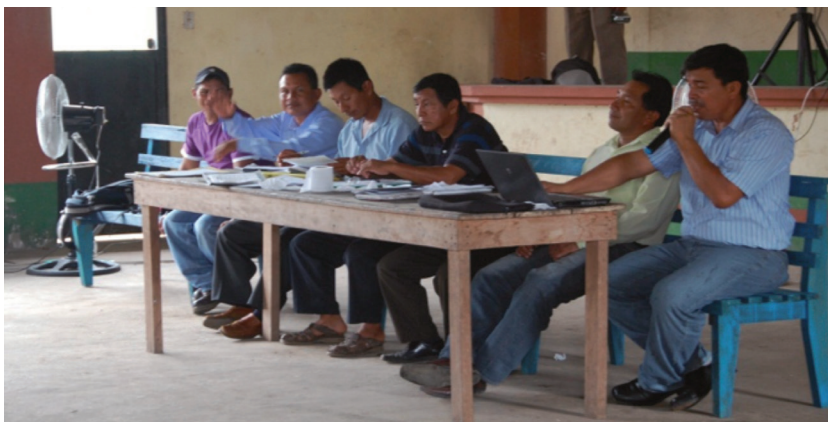
Imagen 3. Reunión de la comunidad para elecciones de autoridades Locales (el Centro de Limoncocha, 17 diciembre, 2011)

La nueva política del gobierno está disminuyendo el tradicional sentido de propiedad y espíritu comunitario. Hay una legalización de la propiedad de la tierra, y la gente recibe escrituras de propiedad; esto contrasta con la cultura comunitaria, donde un sentimiento común que domina es que la tierra pertenece a todos (imagen 3). El formalizar la propiedad