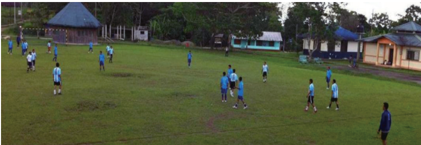
Imagen 1. Actividad deportiva en Limoncocha Arriba: Mujeres jugando al baloncesto (centro de Limoncocha, enero 2012). Abajo: Hombres jugando fútbol (centro de Limoncocha, abril 2012)